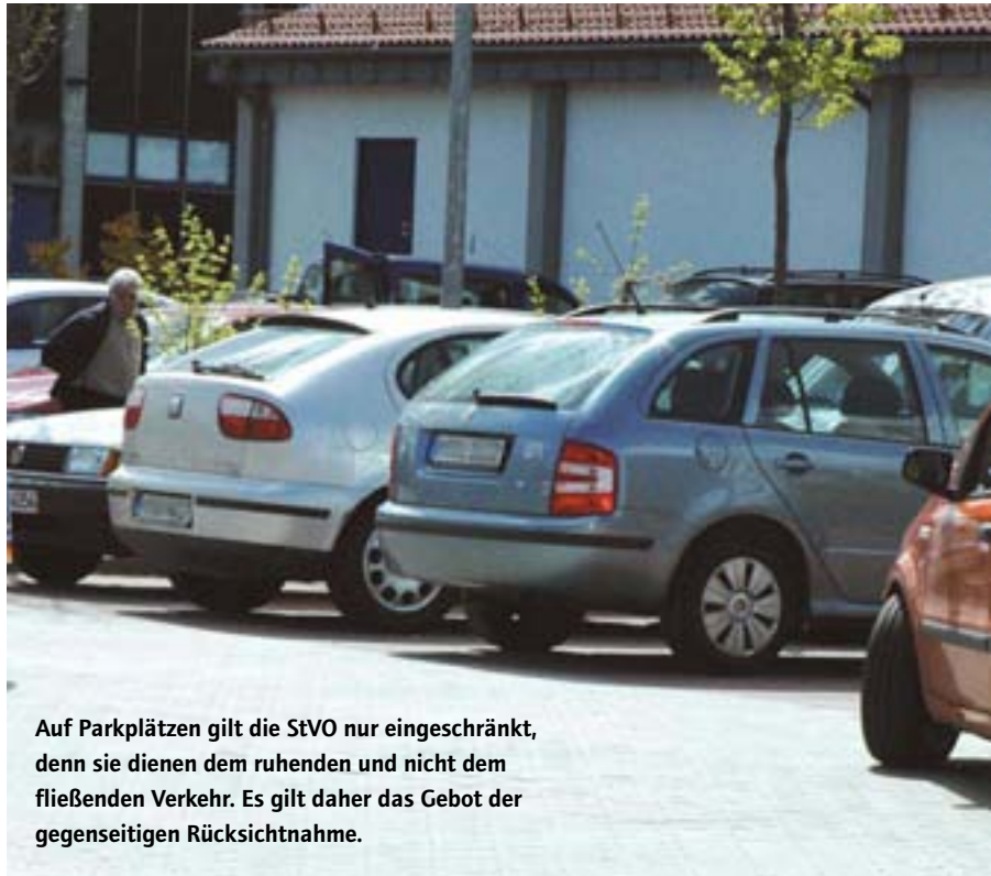
Auf Parkplätzen gilt die StVO nur eingeschränkt, denn sie dienen dem ruhenden und nicht dem fließenden Verkehr. Es gilt daher das Gebot der gegenseitigen Rücksichtnahme.

„Auf großen Parkplätzen von Einkaufsmärkten gilt grundsätzlich die Straßenverkehrsordnung – und zwar